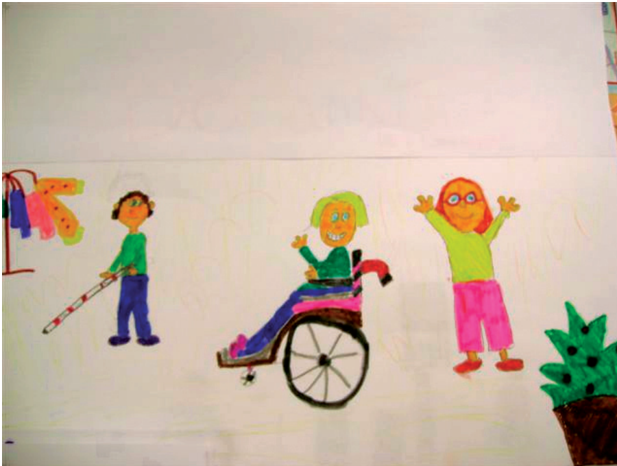
(tekening gemaakt door een van de leerlingen van de Johan Frisoschool)

Het GIPS-team, een groep enthousiaste medewerkers, heeft een flink aantal basisscholen in Dordrecht bezocht. Aan de hand van het Grote Ganzenbordspel hebben zij aan leerlingen van groep 7 op ludieke wijze en vanuit hun ervaringsdeskundigheid voorlichting gegeven over hoe zij met hun beperking omgaan. Maar vooral hoe zij hun mogelijkheden benutten om zelfstandig te kunnen functioneren.